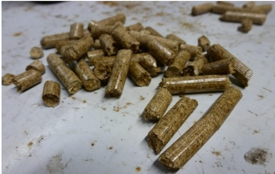
Figure 2: aspect des granulés (test n°3) (Echelle: 100 mm = 80 mm)